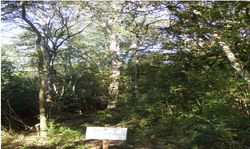
Figura. 1 Ejemplar de Tipuana tipu en fajas de enriquecimiento de 8 mts. de ancho en bosque degradado. Figure. 1 Example tipuana tipu in enrichment strips of 8 m., wide in a degraded forest.