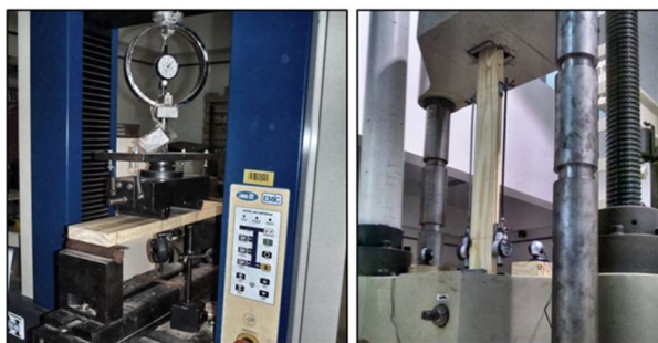
Figura 2. Ensayos estáticos. Izq.: Flexión de plano. Der.: Tracción. Figure 2. Static Testing. Left: Bending test. Right: Tension

En todos los casos la velocidad de desplazamiento del cabezal de carga no superó el valor de los 0,003 de la altura de la probeta (mm/s) y se registraron las deformaciones correspondientes a escalones de carga de 500 N por medio de un comparador micrométrico con precisión de 0,01 mm ubicado en la parte inferior del centro de la luz.